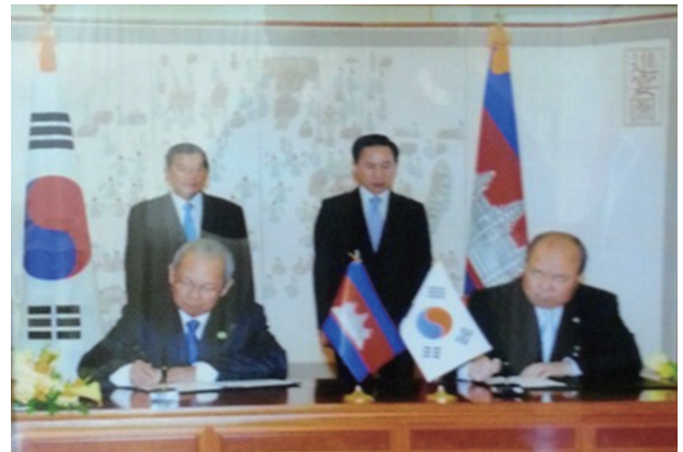
그림 1. 양국 정부간 MOU 체결 모습

보디아 건설부와 한국CM협회 간에 체결된 MOU에 그 근거를 두고 있는데, 정부 차원의 건설외교의 중요성과 이를 뒷받침해 주는 민간 차원의 건설외교의 효과를 다시 한 번 생각해 볼 수 있는 기회라 할 수 있다.