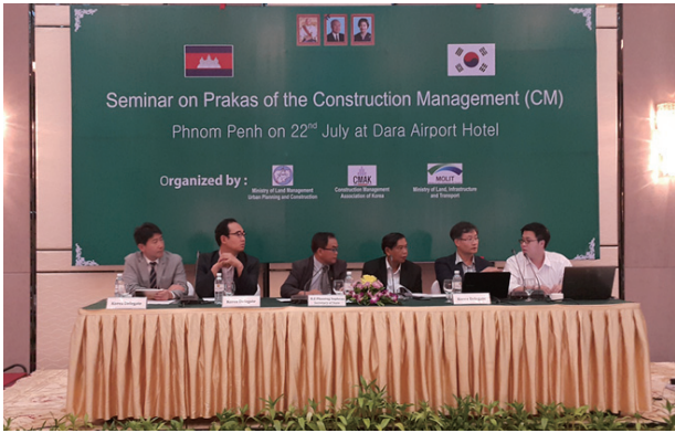
그림 2. CM Prakas 설명회 모습