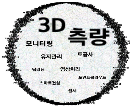
그림 1. 키워드 네트워크 분석 결과