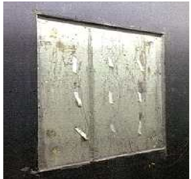
그림 2 KS F 2277에 따른 벽체 열성능 실험

KS F 2277은 벽, 지붕, 천장, 바닥 등의 건축용 구성재의 단열성능으로서의 열관류율, 열저항 등을 보호 열상자 법 및 교정 열상자법에 의하여 측정하는 방법으로 열상자에 시험체를 고정하고, 항온실과 저온실에서 발생하는 열 흐름을 통해 열관류율을 분석할 수 있다. 본 실험에서는 항온실 온도 20.2도, 저온실 온도 -0.33도의 조건에서 KS 2277에 따른 실험을 진행하였으며, 그 결과 총 공급열량 25.07 W 시험체 통과 열량 11.25 W로 전체 열관류율은 0.55 W/m^2k 로 나타났다.